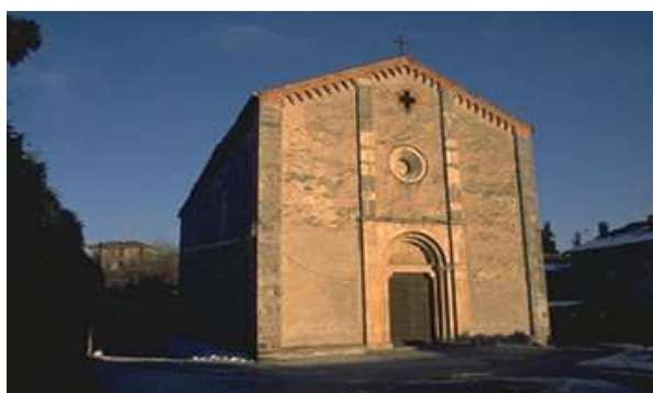
FOTO: Chiesa di Comabbio - Panorama di Cadrezzate - Chiesa di S.Maria della Neve di Monate - Antico Lavatoio di Osmate

almeno in parte a evitare che il lago di Monate (come purtroppo è avvenuto per molti altri laghi) fosse accerchiato da insediamenti industriali e dal turismo d'assalto, con le note conseguenze sulla qualità delle acque. Grazie anche ad una previdente e saggia ordinanza, in forza alla quale è vietata la navigazione a motore, il lago è tuttora uno dei pochissimi bacini di origine glaciale balneabile. Il lago di Monate, unitamente a quello di Comabbio, è sempre stato considerato un'importante fonte di risorse alimentari ed i suoi diritti di pesca sono sempre stati proprietà di grandi famiglie (Biglia, Litta, Arese, Besozzi, Ponti, Borghi, Crespi) che con lo scopo di incrementarne il patrimonio ittico introdussero nuove specie importate dall'estero (persicotrota, trota-arcobaleno, coregone) che si aggiunsero ai pesci nostrani. Venne altresì avviata un'attività commerciale per la coltivazione e la vendita di piante acquatiche e palustri, molte delle quali importate dalle Americhe e che hanno trovato un perfetto habitat in queste acque e che ancora oggi, a distanza di più di mezzo secolo dalla cessazione di questa attività, continuano ad abbellire le sponde del lago..